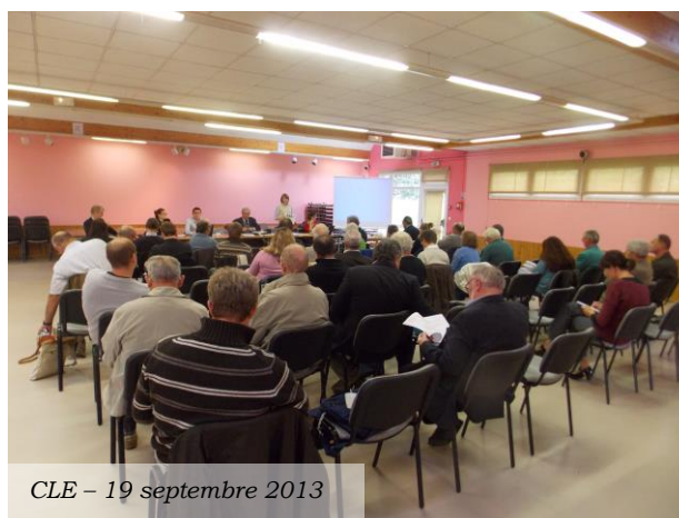
Figure 3 : Réunion de concertation autour de l'élaboration du SAGE

La priorité donnée à la finalisation de la rédaction du SAGE a conduit en 2013 à une mobilisation importante de la CLE et de ses instances : 24 réunions de concertation avec les membres de la CLE et les partenaires techniques se sont ainsi tenues au cours de l'année 2013 (Tableau 6).